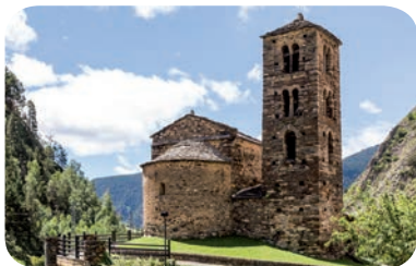
Sant Joan de Caselles